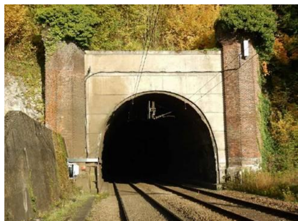
Entrée du tunnel du roule côté Paris