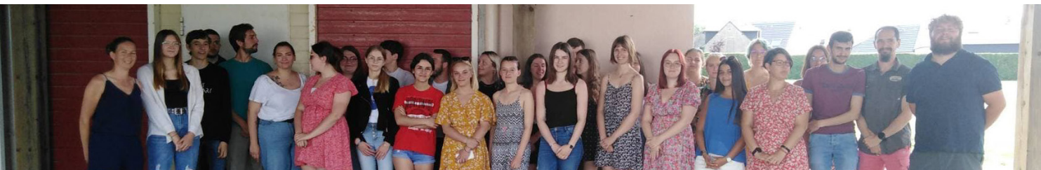
Les équipes d'animateurs sont prêtes à accueillir vos enfants

Ce mois d'animations se terminera le vendredi 26 Août avec un musée vivant qui sera proposé aux familles en les immergeant dans le thème du western. Indiens, cow-boys et shérifs seront donc présents sur tout le mois.