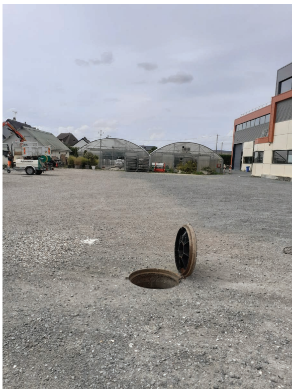
Regard donnant accès aux réserves d'eau pluviale aux services techniques municipaux

Les épisodes de canicule et de fortes chaleurs qui se multiplient ont encouragé la ville à trouver des solutions pour disposer de réserves d'eau.