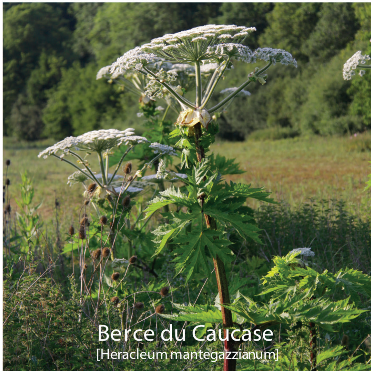
Berce du Caucase [Heracleum mantegazzianum]