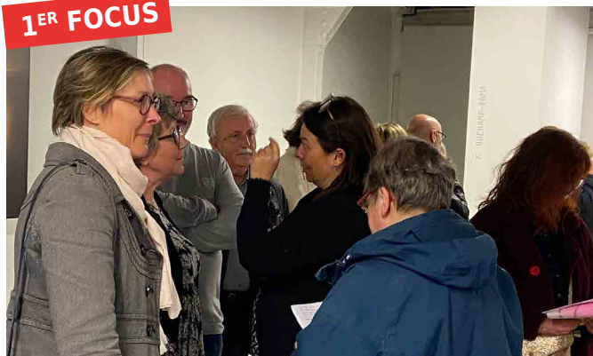
Vernissage de l'exposition Sensations : lumières, levant.