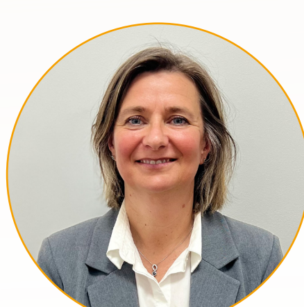
Dominique TALADUN CHAUVEL Maire