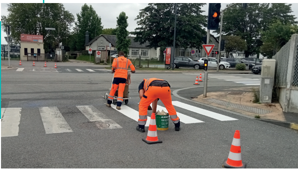
Rue des magasins.