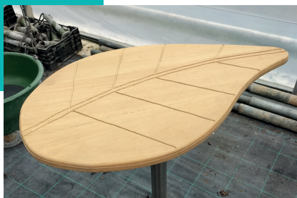
Mobilier en bois élaboré par les Services Techniques.

La municipalité travaille également sur un projet d'éclairage public intelligent permettant d'améliorer la sécurité des déplacements tout en réduisant la consommation énergétique.